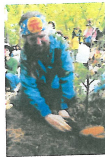
5/2ポール南山に植樹